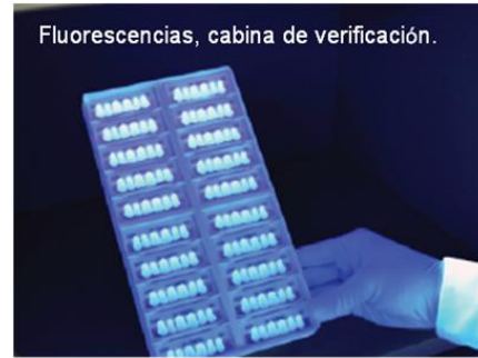
Fluorescencias, cabina de verificación.