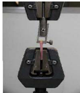
Máquina universal para la prueba de Bonding.