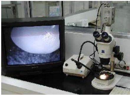
Estéreo microscopio para pruebas de distorsión, blanqueo y agrietamiento, y porosidad.