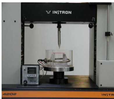
Máquina universal para ensayo de Resistencia y Módulo de flexión

Las propiedades físicas más relevantes son: